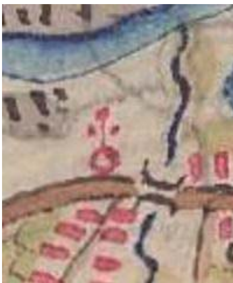
Az első katonai felmérés térképe (1766-1785)

A kápolna eredete a múlt homályába vész. A legidősebbek is úgy emlékeznek rá, hogy már az ő gyerekkorukban is ugyanígy állt a kápolna. Valójában senki nem tudja, hogy milyen régi ez az épület. Már a legrégebbi térképek is egy kápolnát ábrázolnak ezen a helyen. Hogy a térkép által jelzett építmény és a ma is látható kápolna ugyanaz-e, vagy időközben újat emeltek a régi helyén, nem tudjuk. Mindenesetre úgy tűnik, hogy ez a kis építmény falunk legrégebbi épülete.