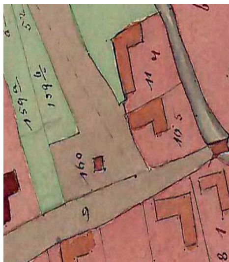
Tagosítási térkép 1867

A régi öregek úgy mesélték, hogy valaha itt volt a falu temetője. Állítólag a régebbi időben a környéken emberi csontok kerültek elő. 1898-ban Reiszig Ede, Vas vármegye főispánjának felhívására, a népszerű Erzsébet királyné tiszteletére, tragikus halálának emléket állítva a megye településein emlékfákat ültettek, így Magyarlakon 2, Háromházban 3 hársfát ültettek. Úgy sejthetjük, hogy Magyarlakon az iskola melletti kápolna két oldalán álló hársfákat ültették ekkor.