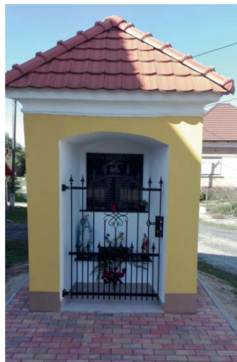
A kápolna napjainkban.