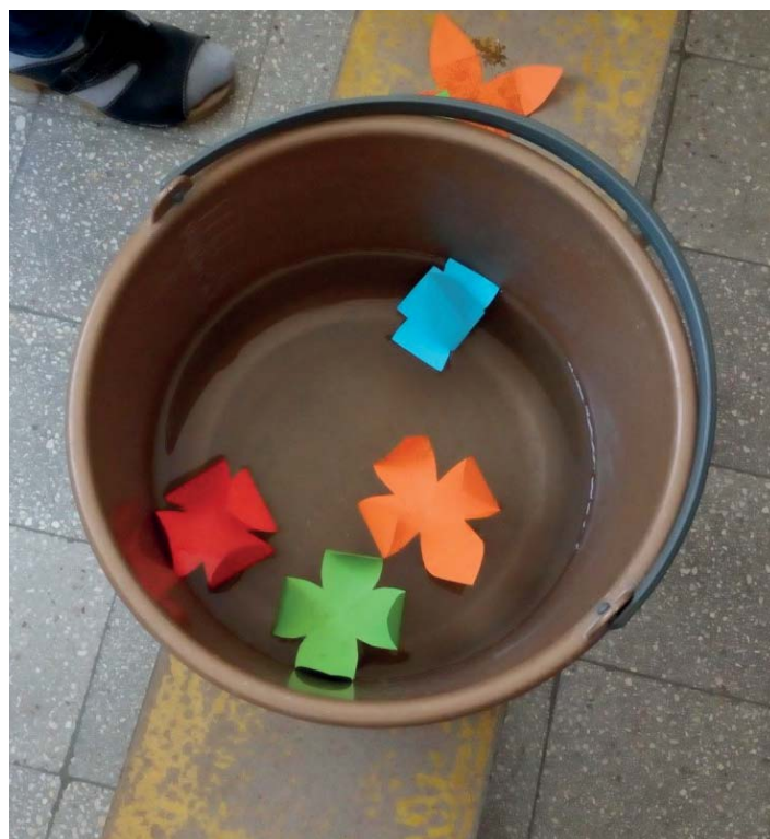
A víztől még a papírvirágok is életre kelnek és kinyílnak