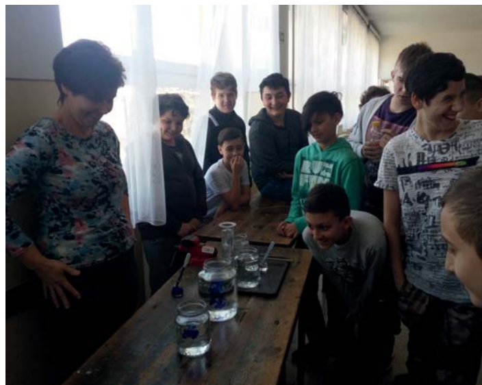
Az örvény tintával színesítve igazán látványos