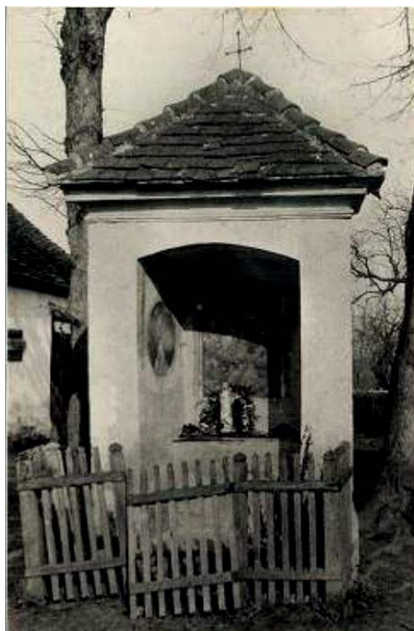
Az 1934 körül készült képeslap tanúsága szerint a hősi halottak táblája még nem volt meg.