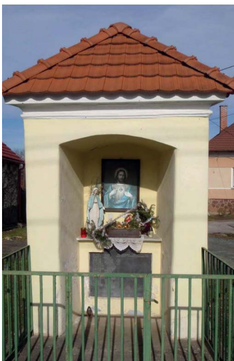
A kápolna a 21. század első évtizedében.