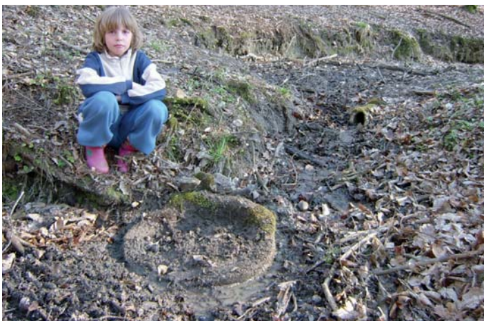
Róbert forrás 2008