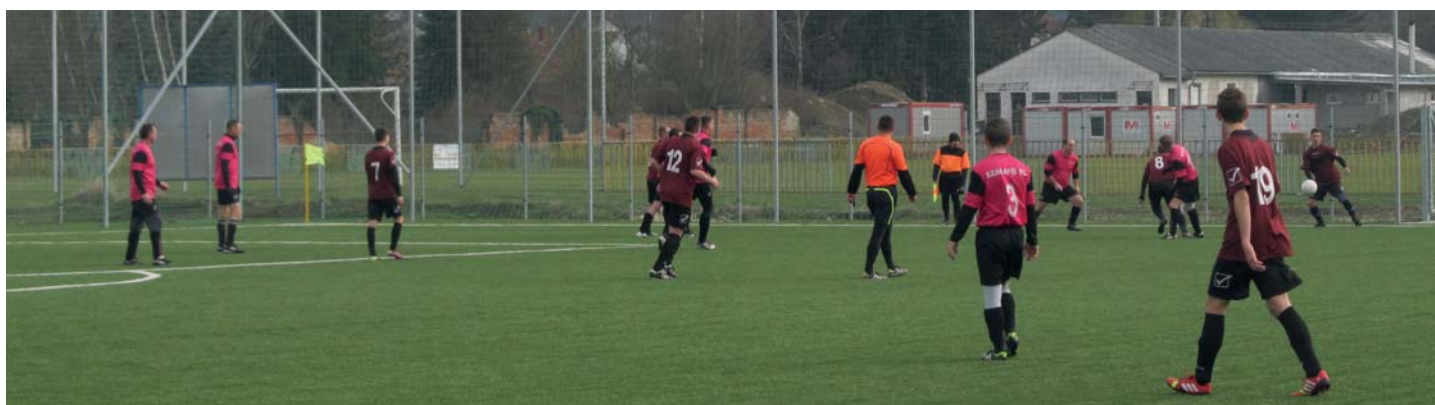
Folyamatosan az ellenfél térfelén a játék. Támadásvezetés ezúttal a jobb szélén.