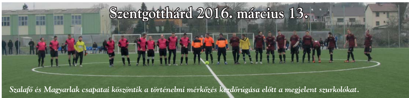
Szalafő és Magyarlak csapatai köszöntik a történelmi mérkőzés kezdőrúgása előtt a megjelent szurkolókat.