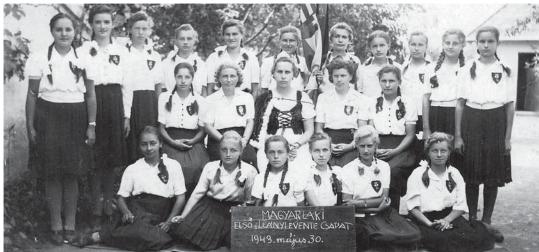
A magyarlakai első leánylevente csapat, 1943. május 30-án, a Hősök Napján.