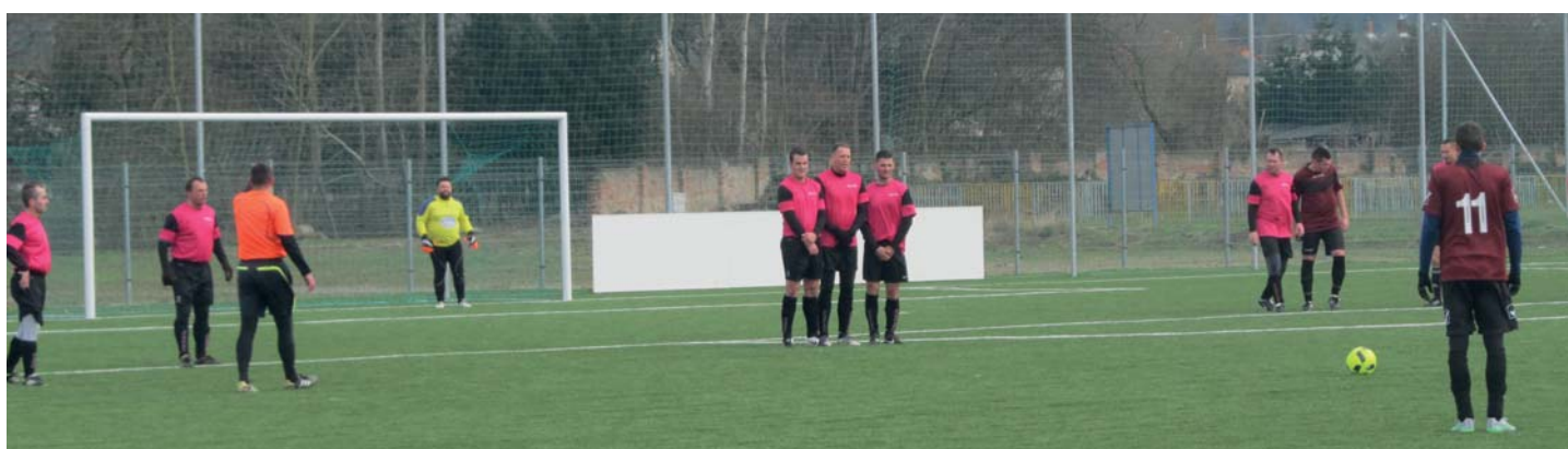
Szabadrúgás Magyarlak javára. A három tagú sorfal kevésnek tűnik, nem?