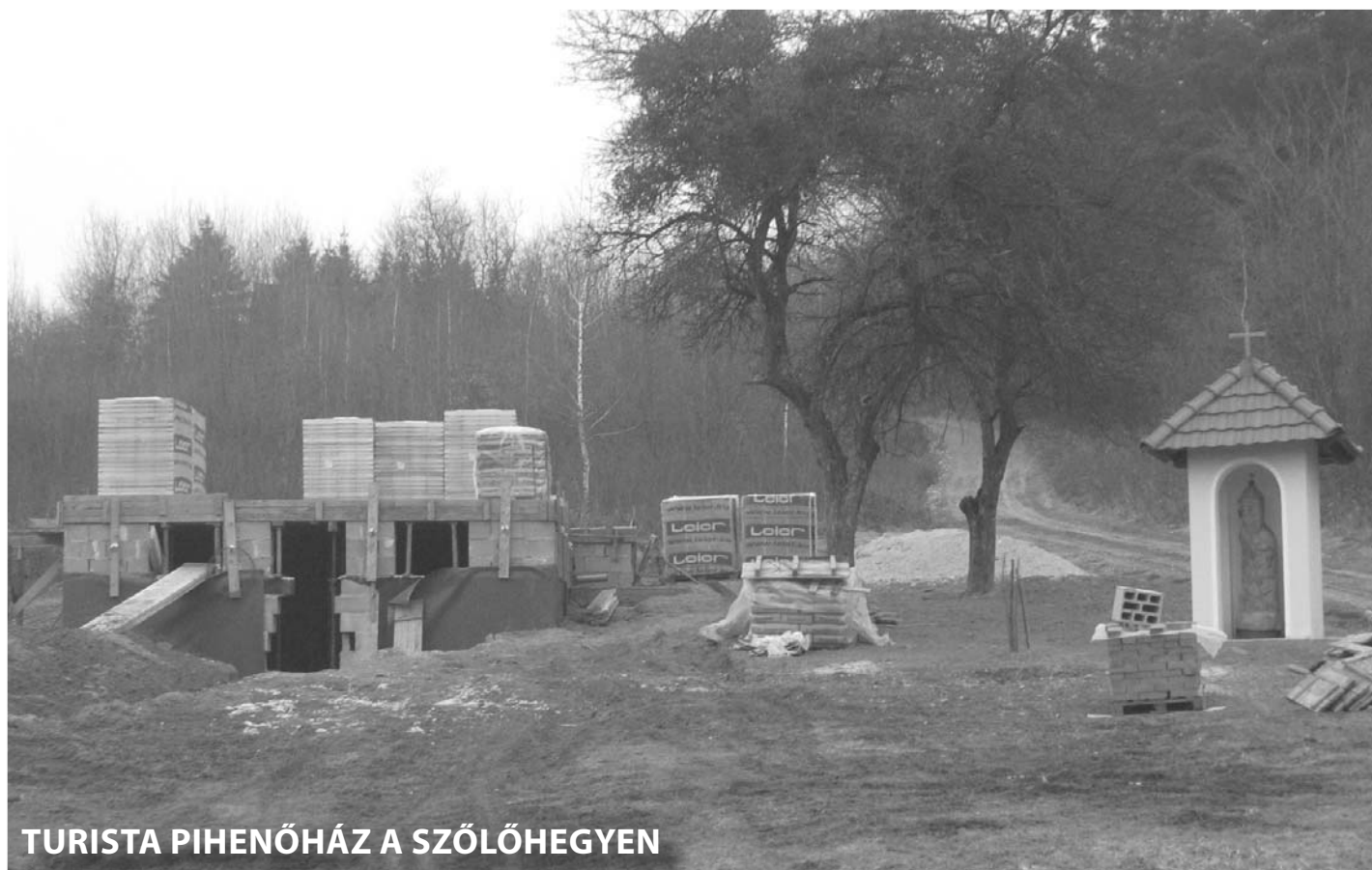
TURISTA PIHENŐHÁZ A SZŐLŐHEGYEN