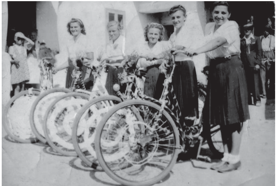
Magyarlakai leányok feldíszített kerékpárokkal az 1950-es években (a kép illusztráció)

1927. szeptember 11-én délelőtt 9 órai starttal a Magyar Kerékpáros Szövetség Nyu-