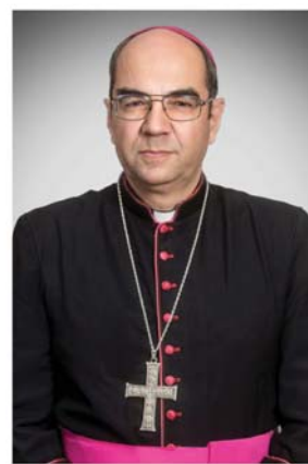
BÉRMÁLÁS MAGYARLAKON 2024. június 23.