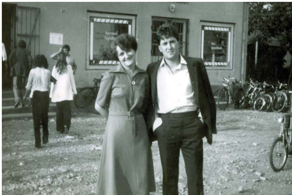
Fiatalok a szövetkezeti kocsmá előtt az 1980-as években.

Az 1848-as jobbágyfelszabadítás eltörölte a feudális előjogokat. Megfelelő engedélyek birtokában és persze megfelelő forgalom mellett bárki üzemeltethetett vendéglőt. Az