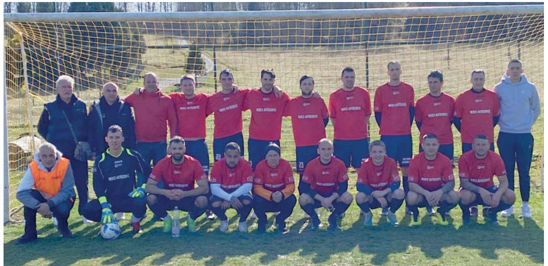
A Magyarlakai Sportkör csapata és vezetőségi tagjai a 2023/24. évad tavaszi szezójának nyitányán a Vas Megyei III. osztályú férfi felnőtt nagypályás labdarúgó bajnokság körmenői csoportjában.