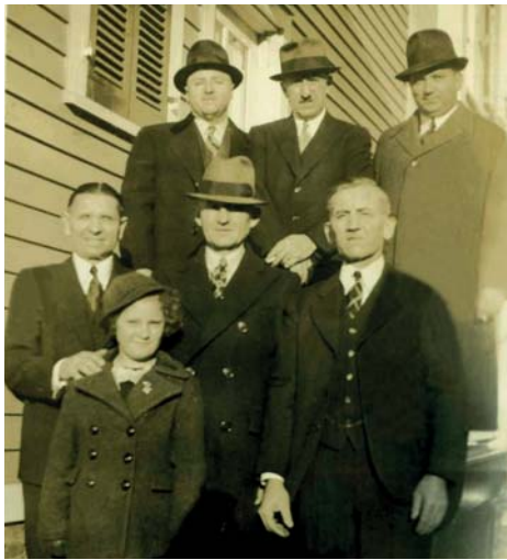
Magyarlakról kivándorolt amerikaiak egy későbbi fényképén, New Brunswick-ban, New Jersey államban.

Magyarlak jelenlévő 600 fő, külföldön távol lévő 75 fő. Háromház jelenlévő 177 fő, külföldön távol lévő 16 fő. Tehát településünkön összesen 91 fő tartózkodott külföldön, jellemzően Amerikában. Közülük sokan,