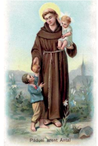
Páduai szent Antal

Csak az lesz tiéd, amit odaadtál, Csak az, mi minden kincsnél többet ér. A tett, a szó, mit szeretetből adtál, Véled marad, s örökre elkísér.