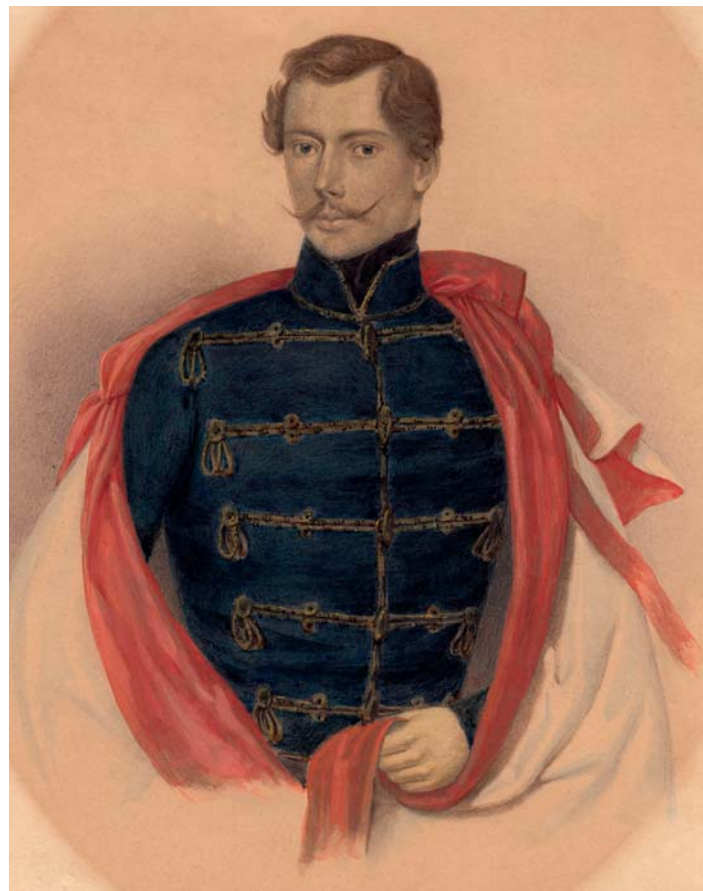
A kép illusztráció. A jakabházi Zichy-kastélyból származó, huszártisztet ábrázoló vízfestmény. A szerző tulajdona.