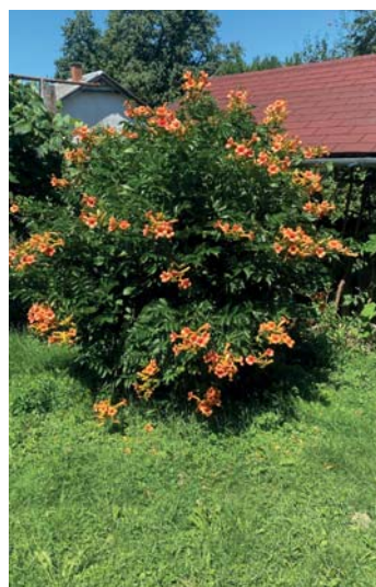
Szépén kifejlett trombitafa

mölcsfák hajtásainak zöld válogatását, a vágásokon sűrűn álló, rossz irányba növekvő hajtásokat távolítsuk el tőlük. Így jobban be-