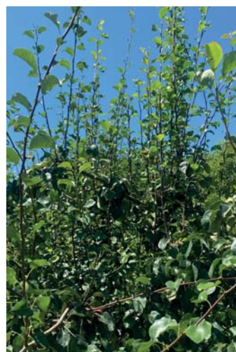
Zöldmetszés előtt álló körtefa vízhajtásokkal

mölcsfák hajtásainak zöld válogatását, a vágásokon sűrűn álló, rossz irányba növekvő hajtásokat távolítsuk el tőlük. Így jobban be-