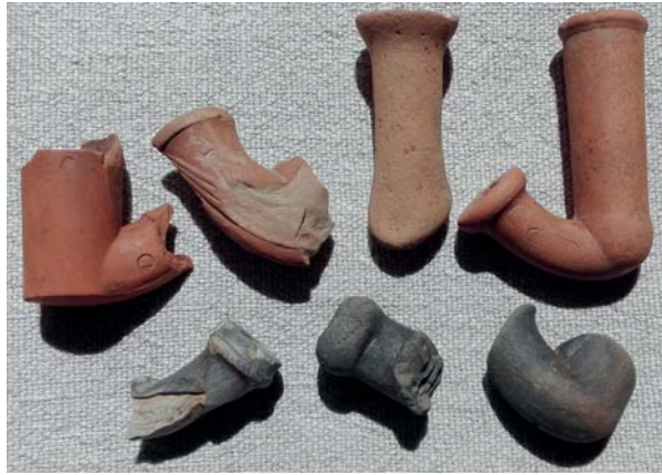
A magyarlakai határban, itt-ott előkerült cseréppipa töredékek

gotthárdhoz közeli falvak lakói, elsősorban a lányok, asszonyok parasztokból bémunkások lettek, és ez a foglalkozás egy teljesen más, ipari-polgári életmód felé vezető útra terelte őket. Az amerikai polgárháború és a krími háború indította el a cigarettázás rohamosan népszerűvé vált divatját. A papírszeletkébe sodort dohány szívása a városi-ipari életmód, a szabadság szimbóluma is volt olyannyira, hogy a 30-as, 40-es évek filmjeinek szereplői szinte le sem tették kezükből a füstölő cigarettát. A cigaretta a férfiaság, a felnőttég, a szabadság jelképe lett. Jól mutatja ezt, hogy e korban készült fényképeken gyakran láthatóak a férfiak, de még a kamaszok is (a fényképész által kellékként osztogatott) cigarettával.